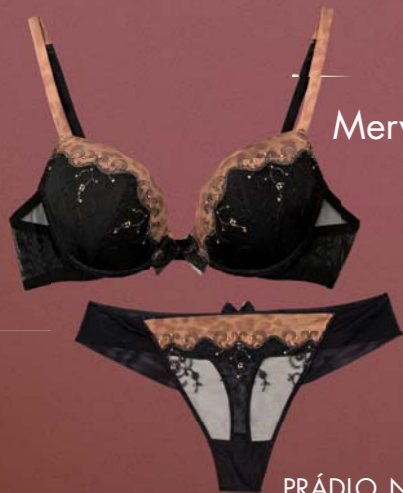
PRÁDLO NA MODELCE: Illusion

Absolut, Obchodní 111, Čestlice; MAJA, OC Spektrum, Čestlice; Le Chaton, Opletalova 18, Praha 1; Bovi, Československé armády 16, Praha 6; Victoria Parker, nám. SNP C2, Pasáž Zlatý Jeleň, Bratislava; Lureka, Hříšně 212, Kosoř; Gemini, SARA, OC Futurum, Ostrava; RBS Lingerie, Václavské nám. 58, Praha 1; Marie Veselá, Růžová 525, Stráž nad Nisou; Hela móda, Řípská 15, Praha 3; Venda, Alžbětina 16, Košice; Chez Parisienne, Pařížská 8, Praha 1; Prádlo – Dagmar Horáčková, Vnoučkova 2131, Benešov; Fascionela, OC Novodvorská Plaz, Praha 4; www.simone-perеле.com