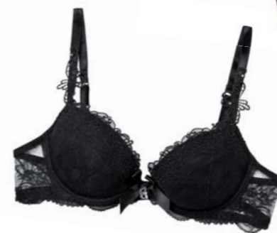
Soir de Venise